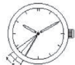
2-секундный интервал движения стрелки

Секундная стрелка начинает двигаться с 2-секундными интервалами, для того чтобы предупредить вас, что часы перестанут работать через несколько дней (Функция предупреждения о недостаточном заряде).