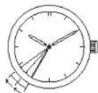
2-секундный интервал движения стрелки

Если часы поместить на свет после остановки, секундная стрелка начнет движение с интервалом 2 секунды (Функция быстрого старта). Время, прошедшее до начала движения стрелки зависит от яркости источника света. Секундная стрелка продолжает движение с 2-секундными интервалами, предупреждая вас о том, что время отображается неверно в результате остановки часов.