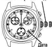
Положение установки даты